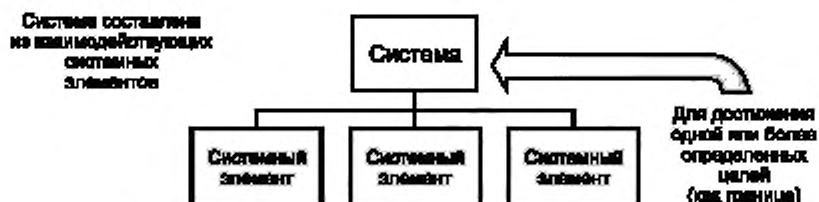
Рисунок 1 — Система и отношения системных элементов

Отношения между системой и ее полным множеством системных элементов могут представляться в иерархии до простейших элементов, относящихся к рассматриваемой системе. Для более сложной рассматриваемой системы предполагаемый системный элемент должен быть самостоятельно рассмотрен как система (которая в свою очередь состоит из системных элементов), прежде чем полное множество системных элементов может быть с уверенностью определено (см. рисунок 2). Таким же способом рекурсивно применяются к рассматриваемой системе и соответствующие процессы жизненного цикла системы, чтобы привести ее структуру к такому представлению, когда осознанные и управляемые системные элементы могут быть реализованы другой стороной (сделаны, закуплены или повторно используются). В то время как на рисунках 1 и 2 подразумеваются иерархические отношения, в действительности имеется большое число систем, которые по каким-то причинам не являются иерархическими, такие как, например, сети и иные распределенные системы.