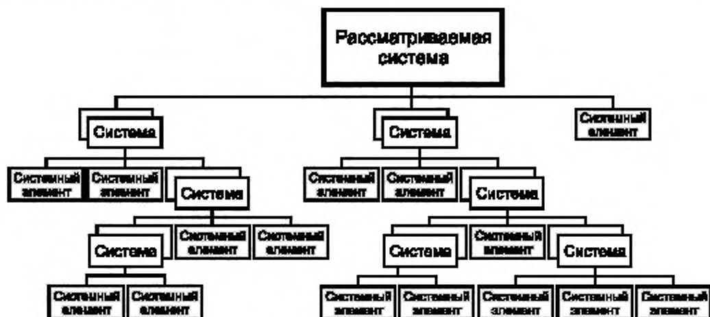
Рисунок 2 — Структура рассматриваемой системы

Отношения между системой и ее полным множеством системных элементов могут представляться в иерархии до простейших элементов, относящихся к рассматриваемой системе. Для более сложной рассматриваемой системы предполагаемый системный элемент должен быть самостоятельно рассмотрен как система (которая в свою очередь состоит из системных элементов), прежде чем полное множество системных элементов может быть с уверенностью определено (см. рисунок 2). Таким же способом рекурсивно применяются к рассматриваемой системе и соответствующие процессы жизненного цикла системы, чтобы привести ее структуру к такому представлению, когда осознанные и управляемые системные элементы могут быть реализованы другой стороной (сделаны, закуплены или повторно используются). В то время как на рисунках 1 и 2 подразумеваются иерархические отношения, в действительности имеется большое число систем, которые по каким-то причинам не являются иерархическими, такие как, например, сети и иные распределенные системы.