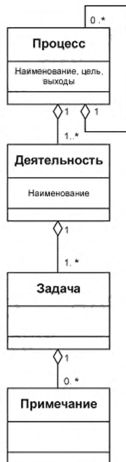
Рисунок D.1 — Конструкции процесса согласно настоящему стандарту и [43]

Примечание используется, когда появляется необходимость в поясняющей информации для лучшего описания содержания или структуры процесса. Примечания обеспечивают понимание, относящееся к реализации или к области применимости, такой как списки, примеры и другие представления.